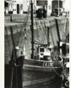
« Saint-Maurice »

Serge LOIT : 06 74 67 88 63 - voiles.cotentines@wanadoo.fr