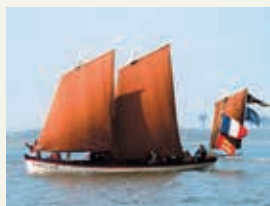
« Fidélité »

02 31 89 05 75 - lachaloupe.honfleur@gmail.com la.chaloupe.honfleur.free.fr