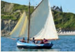
« Jolie Brise »