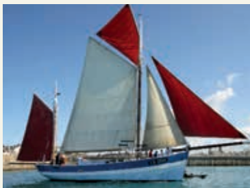
« Vieux Copain »

CHERBOURG (50) « Les voiles écarlates » L'association est une bande de copains réunis par une même passion, l'amour des autres et de la mer. Avec trois bateaux traditionnels, l'association apporte sa contribution à la sauvegarde du patrimoine maritime. L'objectif principal de l'association est l'embarquement des publics en difficulté.