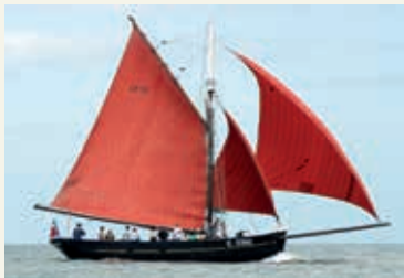
« Grandcopaise »

Dimitri ROGOFF : 06 28 70 01 34 - association@lajoliebrise.com - lajoliebrise.com