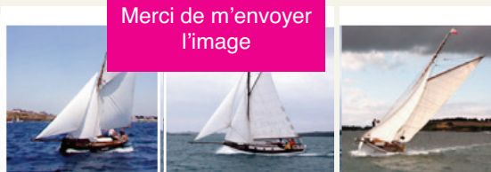
« Winibelle » (1933) « Louise » « Black Joke » (1890)

COUTANCES (50) « la yole du pays de Coutances-Granville » L'association existe depuis 14 ans d'âge (30 adhérents). Elle a pour partenaire les tricots Saint-James et projette le tour de corse à la force des bras et du vent... 06 62 58 18 87