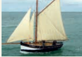
« Saint-Jacques »