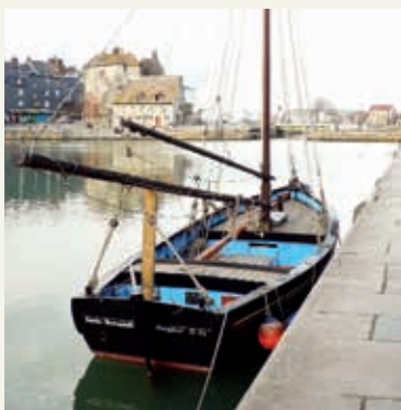
« Sainte-Bernadette » (1926)

Gérard BOURDET : 06 84 19 08 67 gerard.bourdet@wanadoo.fr - voiles-ecarlates.fr